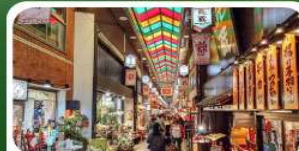
ตลาดปลาชิชิ