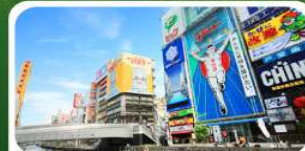
ช้อปปิ้งย่านชินโซบาชิ