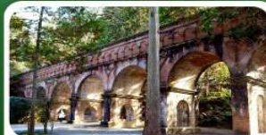
วัดนินเซ็นจิ