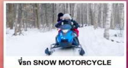
ขี่รถ SNOW MOTORCYCLE