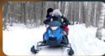
จักรยาน SNOW MOTORCYCLE