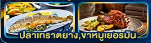
ปลาเทราต์ย่าง, ขาหมูเยอรมัน

Season Germany Austria Czech of romance. Slovenia Hungary