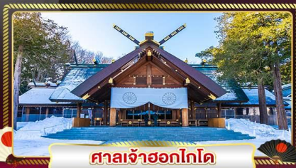
ศาลเจ้าออกโทโด