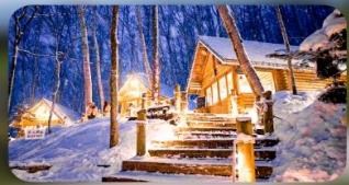
นิงเกิ้ลเทอเรส