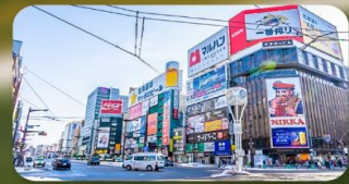
ซูชิโกโบะ