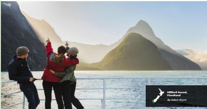
Milford Sound, Fiordland By Adam Bryce

ให้ท่านสัมผัสกับความงามของธรรมชาติโดยรอบ ซึ่งเกิดจากจากเคลื่อนตัวของเปลือกโลก ประกอบกับบรรยากาศเย็นจากขั้วโลกใต้ และสายน้ำกักเซาะ ส่งผลให้เกิดเป็นชายฝั่งเว้าแหว่ง ทำให้เกิดทัศนียภาพอันงดงามบริเวณชายฝั่ง ตื่นตาตื่นใจกับภาพของสายน้ำตกอันสูงตระหง่านของ น้ำตกโบเวน ซึ่งมีความสูง 160 เมตร จากหน้าผา พบกับแมวน้ำนอนอาบแดดบนโขดหินอย่างสบายอารมณ์