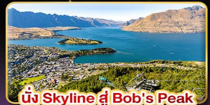
นั่ง Skyline สู Bob's Peak