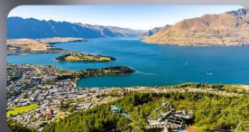
นั่ง Skyline สู่ Bob's Peak