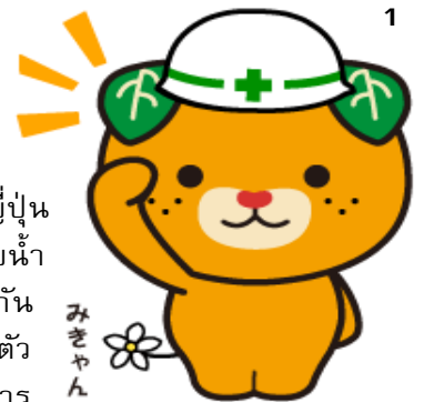
มีแคน มาสคอต เอฮิเมะ

จากนั้นเดินทางต่อไปยังจังหวัด เอฮิเมะ (Ehime) ชม โดโกะออนเซ็น (Dogo Onsen) (ใช้เวลาเดินทาง ประมาณ 2 ชม.) ตั้งอยู่ใจกลางถนนเมืองมัตสึยามะ (Matsuyama) ใน 3 ออนเซ็นเก่าแก่ที่มีประวัติศาสตร์ยาวนานกว่า 3,000 ปี และ กล่าวกันว่าเป็นออนเซ็นที่เก่าแก่ที่สุดในญี่ปุ่น เป็นโรงอาบน้ำสาธารณะ แห่งแรกของญี่ปุ่นที่ได้รับการขึ้นทะเบียนเป็นมรดกทางวัฒนธรรมที่ สำคัญของชาติมาตั้งแต่ปี ค.ศ. 1994 ที่นี้ตัวอาคารไม้กลิ่นอายของญี่ปุ่น โบราณ ตกแต่งด้วยลวดลายรูปนกระยางตามตำนานโบราณ โรงอาบน้ำ แห่งนี้ให้น้ำจากออนเซ็นธรรมชาติหลายแห่งที่มีอุณหภูมิแตกต่างกัน มาผสมกันให้อุณหภูมิของน้ำประมาณ 42 องศาเซลเซียสพอเหมาะแช่ตัว ในน้ำมีแร่อัลคาไลน์ซึ่งอ่อนโยนและไม่ระคายเคืองต่อผิว บรรเทาอาการ เจ็บป่วยและเสริมความงาม