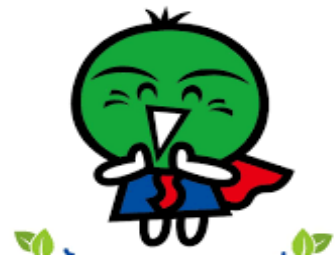
สุดาจิคุง มาสคอตโทคุชิมะ

(เวลาท้องถิ่นเร็วกว่าประเทศไทย 2 ชั่วโมง กรุณาปรับนาฬิกาของท่านให้เป็นเวลาท้องถิ่น เพื่อความสะดวกในการนัดหมาย) หลังผ่านพิธีการตรวจคนเข้าเมืองและศุลกากรเรียบร้อยแล้ว ออกเดินทางไปยังจังหวัด โทคุชิมะ (Tokushima) ประตูลู่ภูมิภาคชิโกกุ (Shikoku) (ใช้เวลาเดินทางประมาณ 2 ชม.) โดดเด่นด้วยธรรมชาติอันอุดมสมบูรณ์ และเป็นแหล่งกำเนิดเทศกาลต้นระเบิดำพื้นบ้าน "อวะโอโดริ" ระดับโลก ที่เก่าแก่ที่สุดของญี่ปุ่น