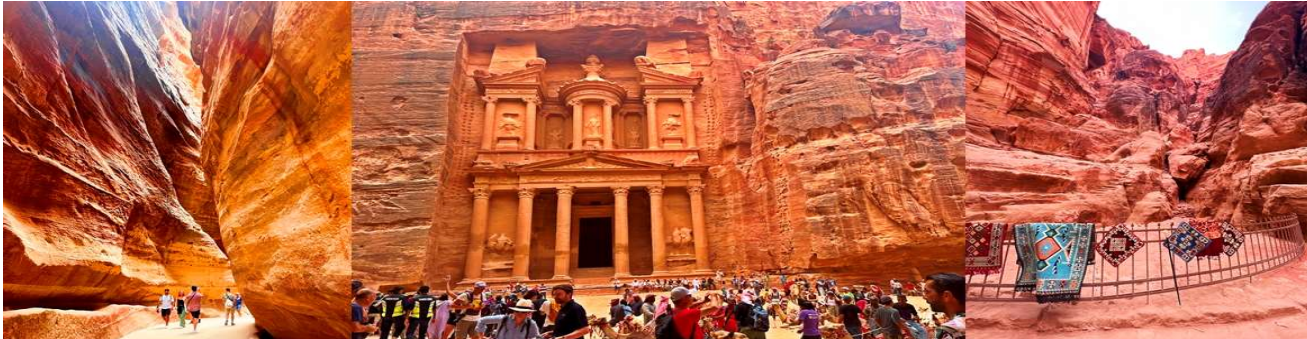
Revise price 10 Sep 2024

รับประทานอาหารเช้า ณ ห้องอาหารของแคมป์ที่พัก นำท่านเดินทางสู่ นครเพตรา Petra (ใช้เวลาเดินทางประมาณ 2 ชั่วโมง) "นครศิลาสีกุหลาบ หรือ The Rose City" ที่ได้รับสมญานามนี้เนื่องจากอาคารบ้านเรือนนั้นแกะสลักบนหินที่มีสีส้มและแดง คำว่าเพตรา นั้นในภาษากรีกมีความหมายว่า "หิน" นำท่านเข้าชมนครเพตรา สัมผัส 1 ใน 7 สิ่งมหัศจรรย์ของโลกยุคใหม่ นอกจากจะขนานนามว่า "นครศิลาสีกุหลาบ The Rose City แล้ว ยังมีอีกฉายาว่า "นครที่สูญหาย หรือ The Lost City" ซึ่งในอดีตนครเพตรา คือ นครแห่งการค้าขายที่มีขนาดใหญ่ เป็นเมืองที่สร้างขึ้นมาตั้งแต่สมัยไบแซนไทน์ ก่อนคริสตกาลถึง 400 ปี โดยพวกนาบาเทียน และถูกทิ้งร้างมานานกว่า 700 ปี จึงถูกค้นพบโดยนักสำรวจชาวสวิสเซอร์แลนด์ นายโจฮันน์ ลุดวิก เบิร์กฮาดท์ ในปี ค.ศ.1812 ต่อมาในปี ค.ศ.1985 นครเพตราจึงได้รับการจดทะเบียนเป็นมรดกโลกจากองค์การยูเนสโก และเคยใช้เป็นสถานที่ถ่ายทำภาพยนตร์ชื่อดัง เรื่อง อินเดียนน่า โจนส์ ชุมทรัพย์สุดขอบฟ้า, Transformers, The Mummy Returns ฯลฯ และยังได้รับการคัดเลือกจากนิตยสาร Smithsonian ให้เป็น 1 ใน 28 สถานที่ที่ต้องไปเยือนก่อนตายอีกด้วย