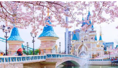
สวนสนุกแห่งนี้

หมู่บ้านนูกซอนฮันอก หมู่บ้านโบราณตั้งแต่สมัยราชวงศ์โชซอน ที่ยังคงสถาปัตยกรรมแบบดั้งเดิม มองไปทางไหนก็เจอแต่บ้านทรงโบราณเหมือนที่เราเห็นในซีรีส์ ทำให้มีนักท่องเที่ยวและวัยรุ่นเกาหลีชอบเช่าชุดฮันบกมาถ่ายรูปที่นี่ จุดถ่ายรูปลยอดฮิตในหมู่บ้านก็คือบริเวณเนินที่มองเห็นหอคอยโซลทาวเวอร์ รวมถึงยังมีบางส่วนที่เปิดเป็นร้านอาหาร คาเฟ่ และเกสต์เฮาส์อีกด้วย