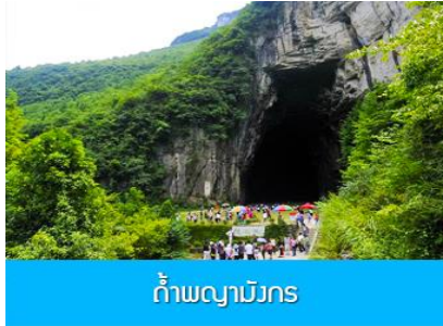
ถ้ำพญามังกร