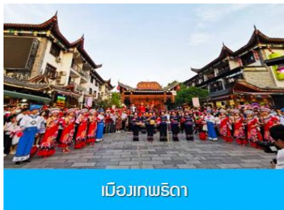
เมืองเทพธิดา