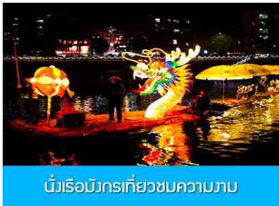
นั่งเรือมังกรเที่ยวชมความงาม