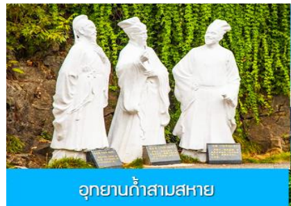
อุทยานถ้ำสามสหาย