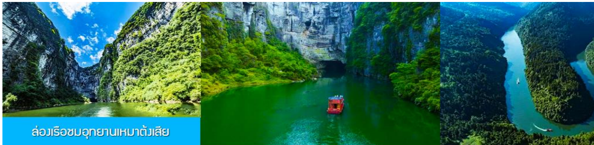
ล่องเรือชมอุทยานเหมาดังเสียดี

นำท่านเดินทางสู่อุทยาน เหมาดังเสียดี 来凤卯洞峡 นำท่านล่องเรือเที่ยวชมทัศนียภาพและความสวยงามของช่องแคบเหมาดังเสียดี สายน้ำสีมรกตที่ไหลคดเคี้ยวไปตามช่องแคบระหว่างหน้าผาสูงชันและภูเขา ผ่านถ้ำน้อยใหญ่หลายแห่งที่เคยเป็นที่ซ่อนตัวของโจรที่หลบหนีการตามล่าของทางการ (ใช้เวลาล่องเรือประมาณ 45 นาที)