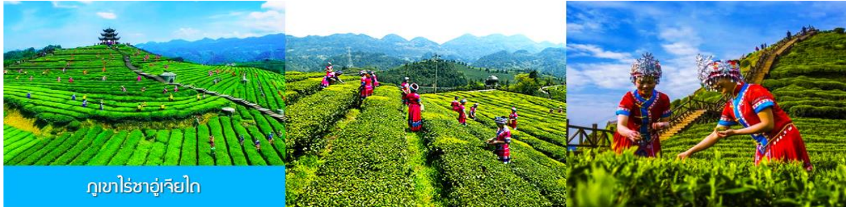
ภูเขาไร่ชาอู่เจียโก

พักที่ โรงแรม ENSHI XIPU HOTEL ระดับ 4 ดาวท้องถิ่นหรือเทียบเท่าในเมืองเฉินซี