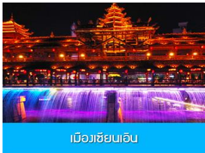
เมืองเซียนเอิน