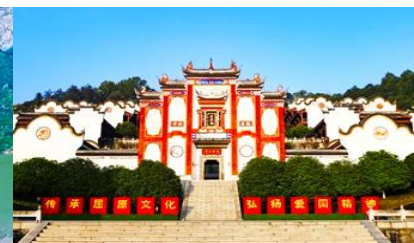
บ้านเกิดกวี ชิวหยวน