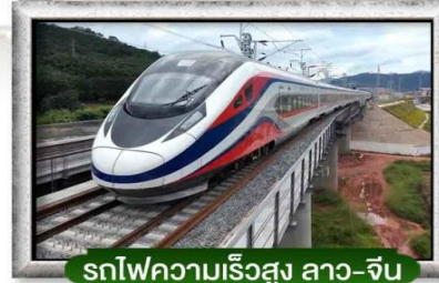
รถไฟความเร็วสูง ลาว-จีน