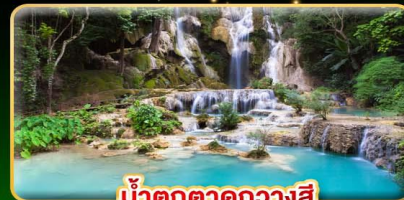
น้ำตกตาดกวางสี