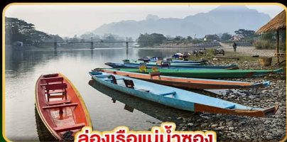
ล่องเรือแม่น้ำซอง