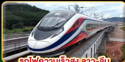
รถไฟความเร็วสูง ลาว-จีน