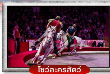
โชว์ละครสัตว์