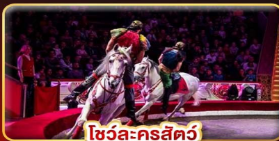
โชว์ละครสัตว์