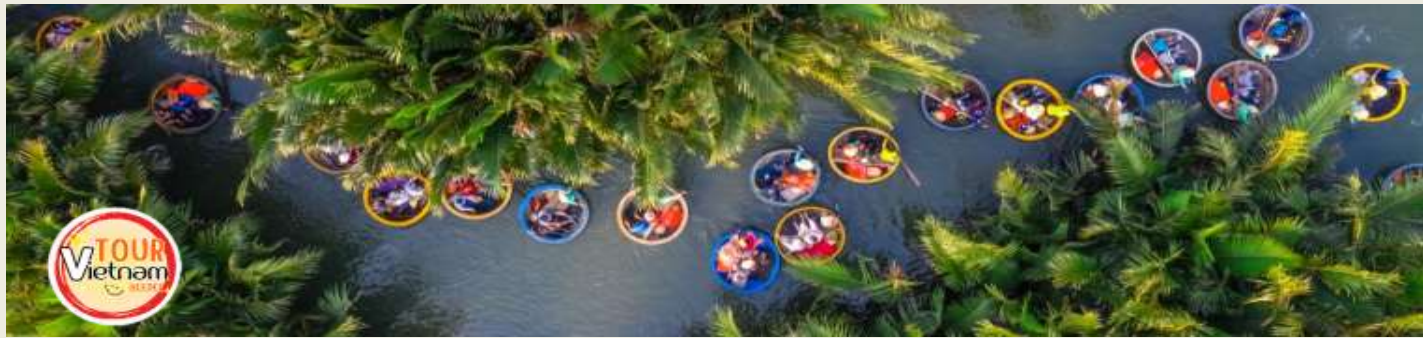
หน้า 8 (ภาพใช้เพื่อการโฆษณาเท่านั้น)

จากนั้นเดินทางต่อไปยัง หมู่บ้านแกะสลักหินอ่อน ซึ่งเป็นหมู่บ้านที่เก่าแก่และยึดถืออาชีพการแกะสลักหินอ่อนมาช้านาน เป็นร้านของฝากท้องถิ่นที่มีสินค้ามากมาย จากนั้นแวะ ช้อปปิ้งร้านกาแฟ เลือกซื้อของฝาก