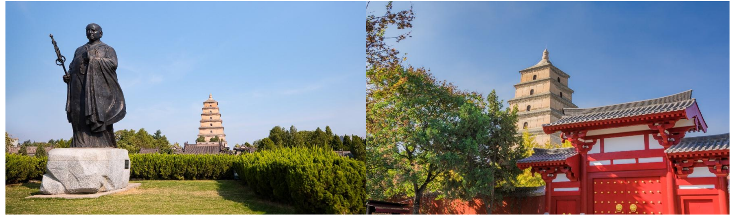
กว่าพันเล่ม

จากนั้นนำท่านเดินทางสู่ เจดีย์ห้าพันปีใหญ่ แห่งวัดฉือเอิน สร้างเสร็จในปีค.ศ. 652 โดย ถังเกาเจง(หลี่จื้อ) ย่องเต๋องค์ที่สาม แห่งราชวงศ์ถัง และ ได้นิมนต์พระภิกษุสวนจิ้ง หรือรู้จักในนามพระถังซัมจั๋ง พระเถระที่มีชื่อเสียงที่สุดในสมัยถัง ซึ่งใช้เวลากว่า 15 ปีจาริกไปถึงอินเดียและได้นำพระธรรมคำสั่งสอนในพระพุทธศาสนา กลับมาเผยแพร่ในแผ่นดินจีนให้มาอยู่ที่วัดฉือเอินแห่งนี้พระถังซัมจั๋งได้ใช้เวลาออกแบบและร่วมสร้างเจดีย์ห้าพันปีใหญ่ในวัดฉือเอินเพื่อใช้ในการเก็บรักษาพระไตรปิฎก ที่ท่านได้นำมาจากอินเดียและแปลเป็นภาษาจีนนับจำนวน