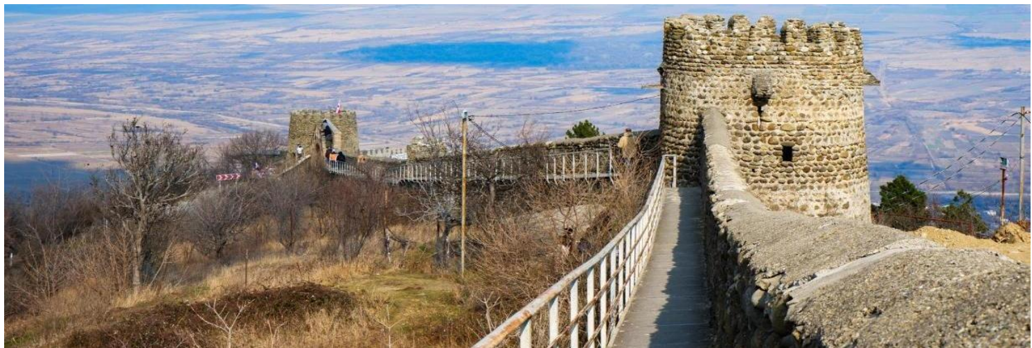
ถ่ายภาพเช็กอินกับ วิหารบอดดี (Bodbe Monastery) สถานที่ศักดิ์สิทธิ์ มีสถาปัตยกรรมแบบจอร์เจียนที่มีความงดงามและเรียบง่าย วิหารตั้งอยู่บนเนินเขา ทำให้สามารถมองเห็นวิวทิวทัศน์ของหุบเขาอะลาซานี (Alazani Valley) และเทือกเขาคอเคซัสได้อย่างงดงาม