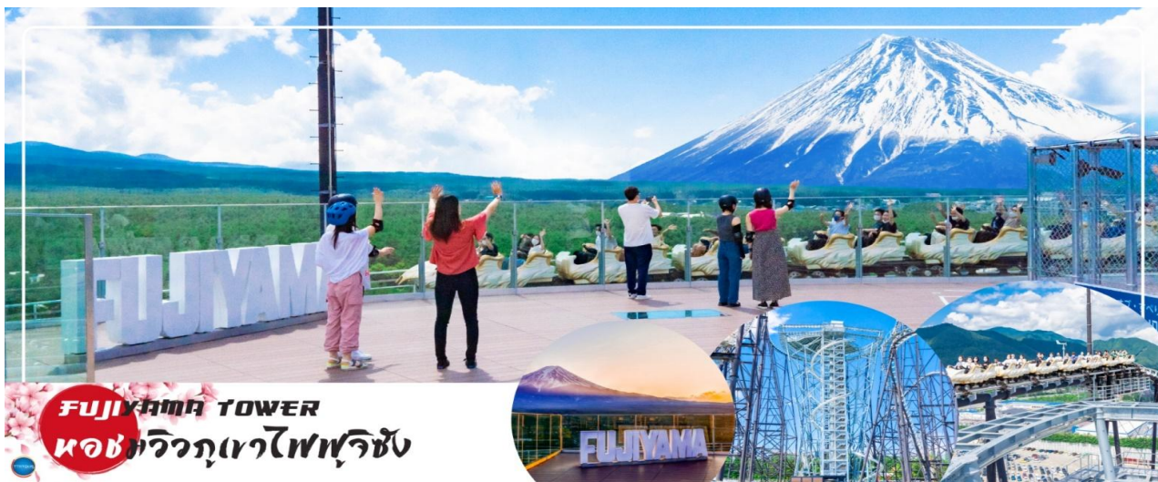
FUJIYAMA TOWER ห้องชมวิวภูเขาไฟฟูจิซัง

ในบริเวณเดียวกันนำท่านขึ้นสู่จุดชมวิว FUJIYAMA TOWER เป็นหอคอยชมวิวที่ทางสวนสนุก Fuji-Q Highland สร้างขึ้นเนื่องในโอกาสที่รถไฟเหาะ Fujiyama ครบรอบ 25 ปี โดยสร้างขึ้นที่ด้านในสวนโค้งของรางรถไฟเหาะ Fujiyama ซึ่งเป็นจุดที่สามารถมองเห็นวิวของภูเขาไฟฟูจิได้เต็มตา หอคอยชมวิวแห่งนี้มีความสูงอยู่ที่ 55 เมตร โดยบริเวณชั้นบนสุดของหอคอยได้ถูกสร้างเป็นดาดฟ้าชมวิวแบบ 360 องศา ซึ่งมีชื่อว่า "Fujiyama Sky Deck Observatory" สามารถขึ้นไปเพื่อชมวิวของภูเขาไฟฟูจิได้โดยไม่ต้องนั่งรถไฟเหาะ นอกจากนี้ภายในหอคอยยังมีกิจกรรมสำหรับผู้ชื่นชอบความหวาดเสียว นั่นก็คือ "Fujiyama Walk" ซึ่งเป็นทางเดินวงกลมรอบหอคอยที่ไม่มีราวจับ จะมีก็เพียงสายรัดที่ยึดเอาไว้กับตัวเท่านั้น และอีกอย่างคือ "Fujiyama Slider" สไลเดอร์แบบท่อที่จะสไลด์ลงจากชั้นดาดฟ้าชมวิวลงสู่พื้นดิน (ไม่รวมค่าเครื่องเล่น Fujiyama Walk และ Fujiyama Slider)