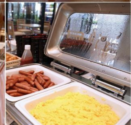
Asia Narita Hotel