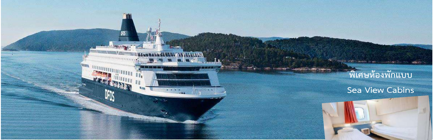
พิเศษห้องพักแบบ Sea View Cabins