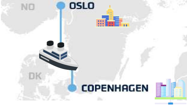
พิเศษ มื้อค่ำ DFDS Buffet Scandinavia

ท่าเทียบเรือสำราญ เพื่อส่งเรือสำราญ DFDS จากเมืองออสโล ประเทศนอร์เวย์ สู่ เมืองโคเปนเฮเกน ประเทศ เดนมาร์ก (DFDS Scandinavian Seaway From Oslo, Norway to Copenhagen, Denmark) ลูกทัวร์ทุกท่าน นำสัมภาระทั้งหมดขึ้น ลงเรือ DFDS และเตรียม สัมภาระบางส่วน เพื่อใช้ในการเข้าพักบนเรือสำราญ 1 คืน) ที่พร้อม พร้อมไปด้วยร้านค้าปลอดภาษี, ร้านอาหาร, ห้องชานา, สปา, โรง ภาพยนตร์ และ จุดชมวิว ฯลฯ *รอบของการ ส่งเรืออาจเปลี่ยนแปลงได้ตามความเหมาะสม กรณีไม่สามารถส่งเรือได้ ทางบริษัทขอสงวนสิทธิ์ไม่สามารถคืนค่าใช้จ่าย เนื่องจากเป็นการชำระล่วงหน้ากับผู้แทนเรียบร้อยแล้วทั้งหมด หากได้รับเงินคืนจากผู้แทนทางเราจะดำเนินเงินคืนลูกค้าใน ภายหลัง*