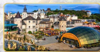
บาน่าฮิลล์