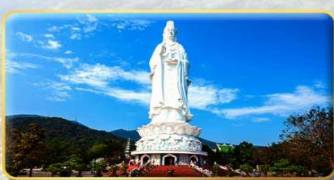
วัดลินห์อิ่ง