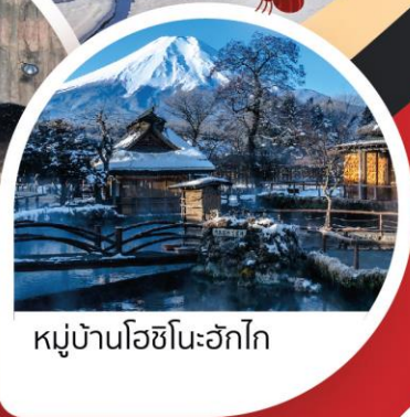
หมู่บ้านโอชิโนะฮักไก