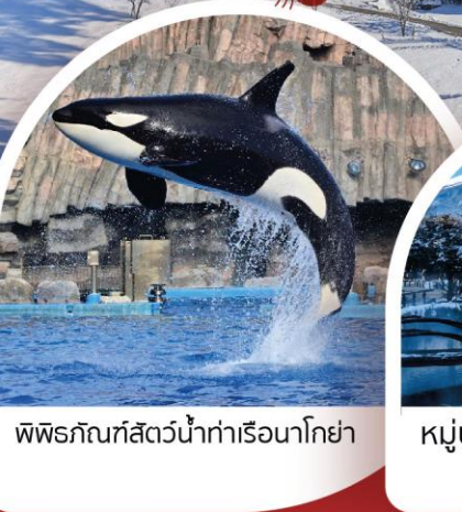
พิพิธภัณฑ์สัตว์น้ำท่าเรือนาโกย่า