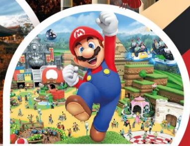
ทิวไรเสริม Universal Studio