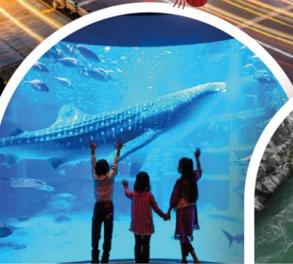
พิพิธภัณฑ์สัตว์น้ำโคคุยกัง