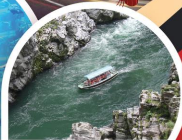
ล่องเรือในแม่น้ำช่องเขาโอโตะเคะ