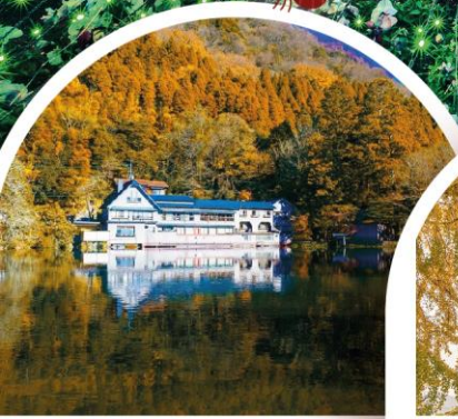
ทะเลสาบคิริน