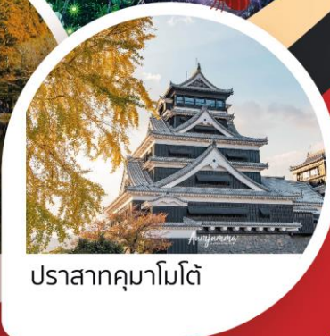
ปราสาทคумаโมโต้