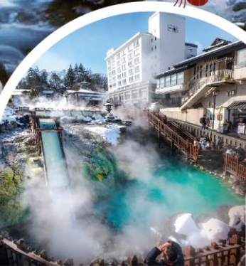
คุซัทสึออนเซ็น