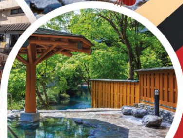
ชิมะ ออนเซ็น