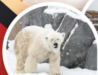
สวนสัตว์อาซาฮิยาม่า