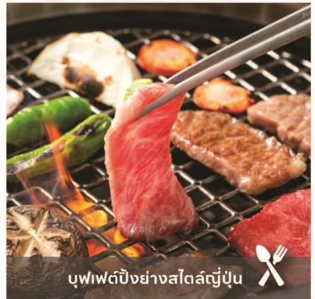
บุฟเฟต์ปิ้งย่างสไตล์ญี่ปุ่น