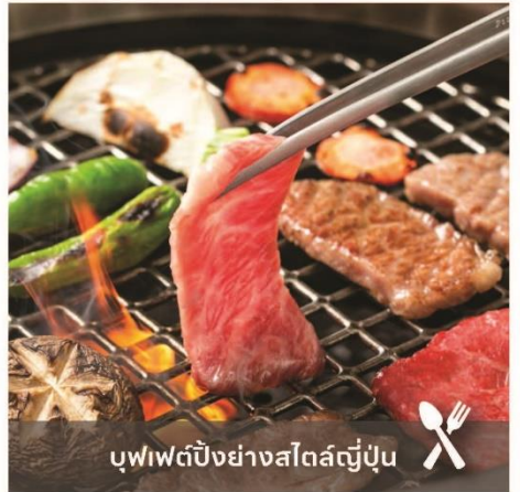
บุฟเฟต์ปิ้งย่างสไตล์ญี่ปุ่น