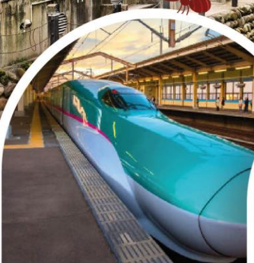
นั่งรถไฟชินคันเซ็น