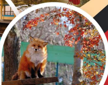
หมู่บ้านสุนัขจิ้งจอกซาโอะ