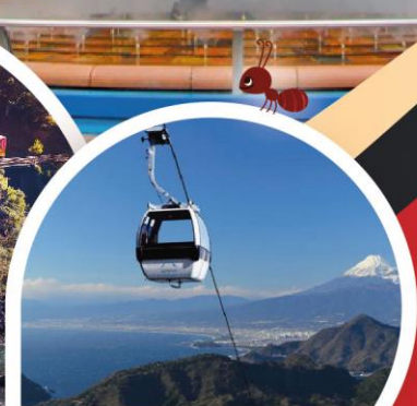
อิสึโนะคุนิ พาโนราม่าพาร์ค

โอซาก้า ◦ อาราชิยาม่า ◦ เกียวโต ◦ อาโกเน่ ◦ โตเกียว