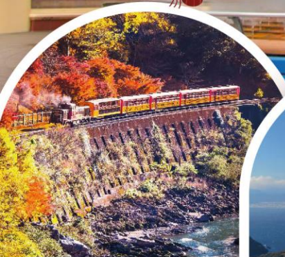
รถไฟอาราชิยาม่า