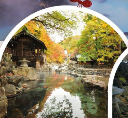
ตาการะ: ออนเซ็น