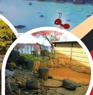
อิคาโฮะ: ออนเซ็น