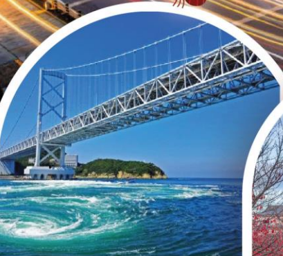
สะพานคนเดิน อุซุ โนะ มิชิ