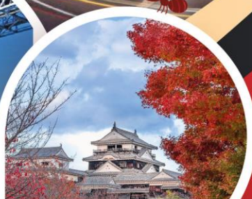
ปราสาทมัตสึยามะ