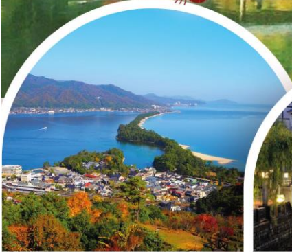
อามาโนะฮาซิดาเตะ