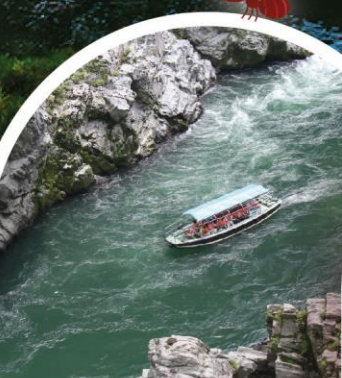
ล่องเรือในแม่น้ำ ช่องเขาโอโตะ