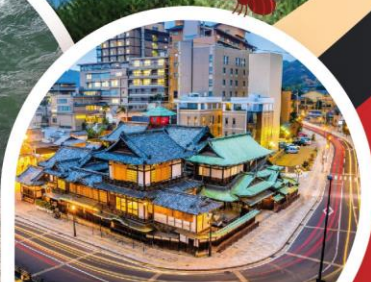
โดโกะออนเซ็น