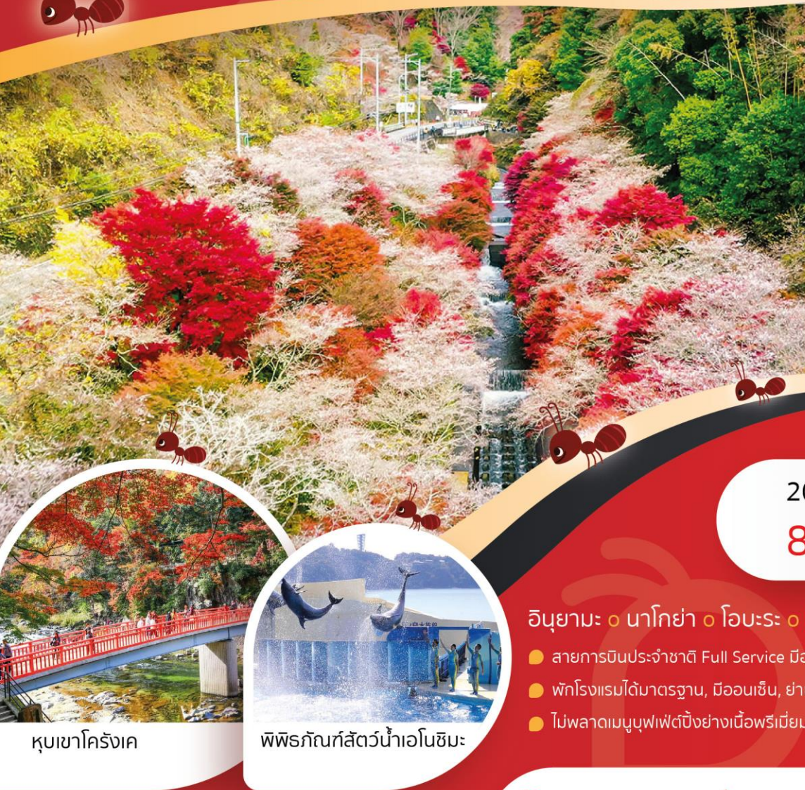
หุบเขาครึ่งศตวรรษ