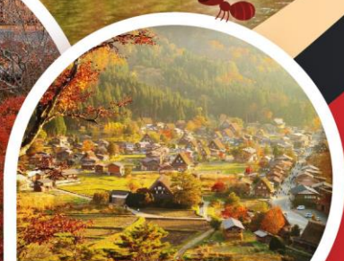
หมู่บ้านชิราคาวาโกะ (ชิโรยาม่า)