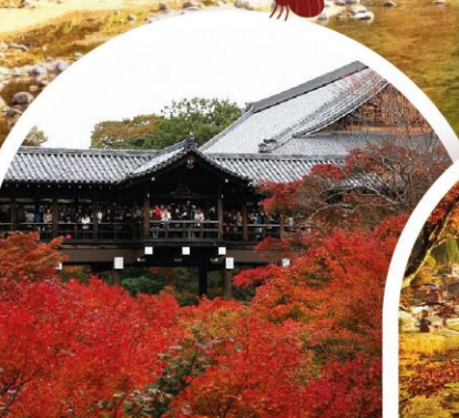
วัดโทฟุคุ