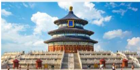
หอบูชาฟ้าเทียนถาน