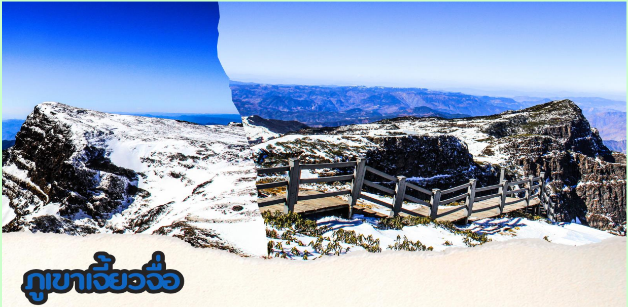
ภูเขาเจี๋ยวจื่อ

จากนั้น นำท่านเดินทางสู่ ภูเขาหิมะเจี๋ยวจื่อ (JIAOZI MOUNTAIN) ภูเขาหิมะแห่งเมืองคุนหมิง สถานที่เที่ยวแห่งของมณฑลยูนนาน ที่เพิ่งมีการสร้างกระเช้าขึ้นบนยอดเขาในปี 2555 นำท่านนั่ง รถเบตเตอร์ ของทางอุทยาน (ใช้ระยะเวลาโดยประมาณ 20 นาที)