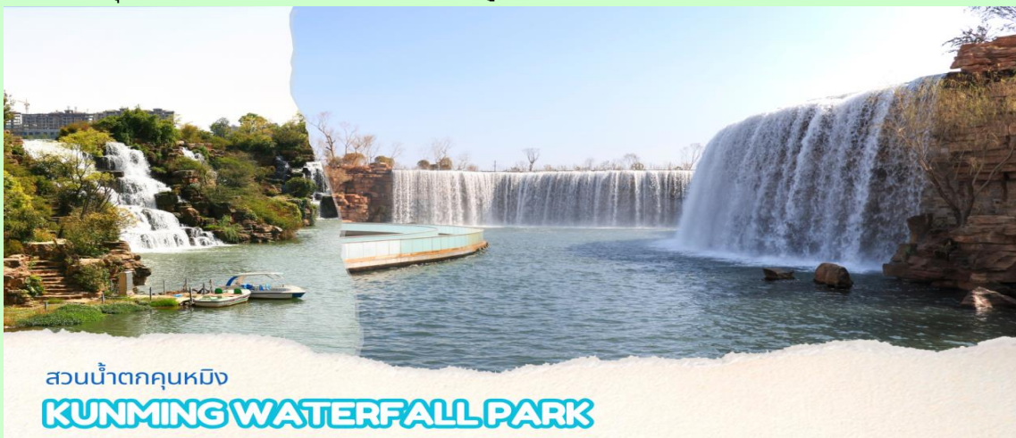
สวนน้ำตกคุนหมิง KUNMING WATERFALL PARK