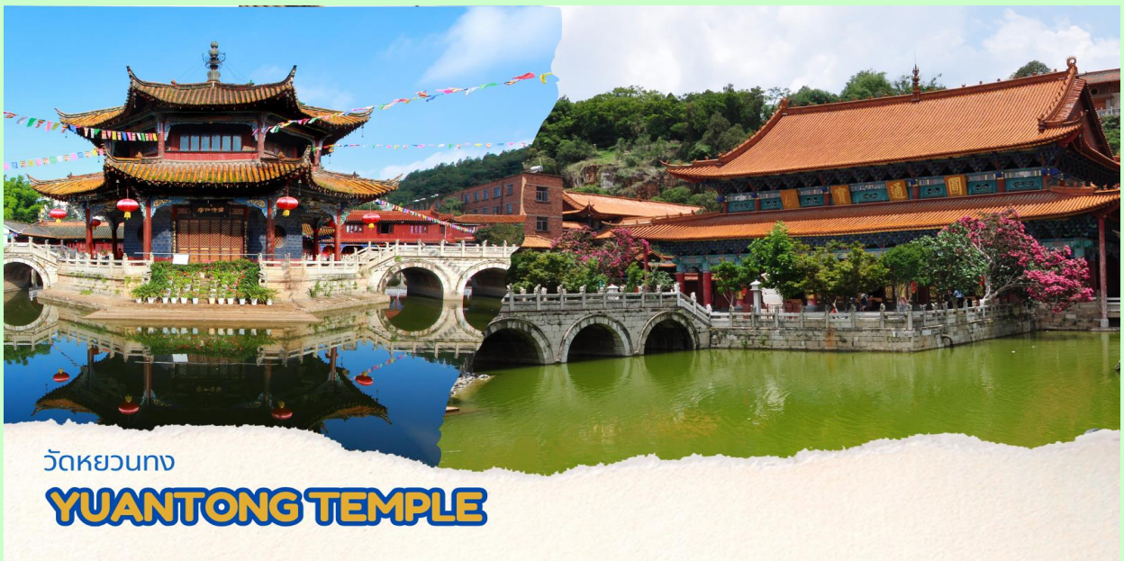
วัดหยวนทอง YUANTONG TEMPLE

เดินทางสู่ วัดหยวนทอง (Yuan tong Temple) เป็นวัดที่ใหญ่และเก่าแก่ที่สุดของมณฑลยูนนาน ตั้งอยู่ที่ถนนหยวนทองเจียง สร้างมาตั้งแต่สมัยราชวงศ์ถังมีอายุยาวนานประมาณ 1,200 กว่าปี ภายในวัดตกแต่งร่มรื่นสวยงาม กลางลานมีสระน้ำขนาดใหญ่ แต่การสร้างวัดแห่งนี้ดูแล้วจะแปลกตากว่าวัดอื่น ๆ ในจีน เพราะปกติแล้วการสร้างวัดของจีนส่วนมากจะต้องสร้างอยู่บนภูเขา มีแต่วัดหยวนทองที่สร้างแปลกที่สุดในจีนคือสร้างวัดต่ำกว่าภูเขา โดยวิหารจะอยู่ต่ำที่สุด เนื่องจากวัดแห่งนี้ ไม่ได้สร้างขึ้นเพื่อเป็นวัดโดยตรง แต่เคยเป็นศาลเจ้าแม่กวนอิมมาก่อน ดังนั้นคำว่า “หยวนทอง” จึงเป็นชื่อที่ปรากฏในคัมภีร์ของเจ้าแม่กวนอิม มีสะพานข้ามไปสู่ศาลาแปดเหลี่ยมกลางสระน้ำมรกต มีทั้งปลา, เต่าอยู่มากมาย ศาลาหลังนี้สร้างขึ้นในสมัยราชวงศ์ชิง ในศาลาประดิษฐาน “เจ้าแม่กวนอิมพันกร และเจ้าแม่กวนอิมพม่า หรือเรียกว่า “เจ้าแม่กวนอิมหยก”