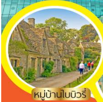
หมู่บ้านไบบิวรี่