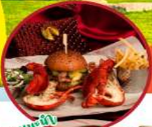
บุฟเฟ่ต์ ปอริเตอร์&ลอบสเตอร์