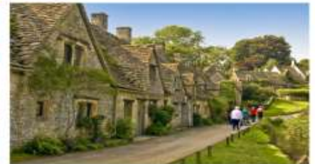
หมู่บ้านโบนิวรี