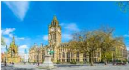
แมนเชสเตอร์