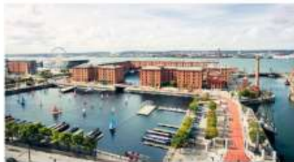
ลิเวอร์พูล