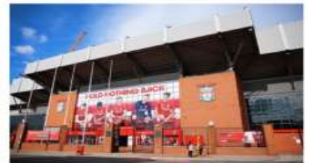
สนามแอนฟิลด์