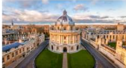
อ็อกฟอร์ด