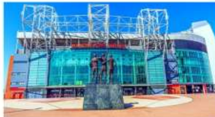
สนามโอลด์แทรฟฟอร์ด