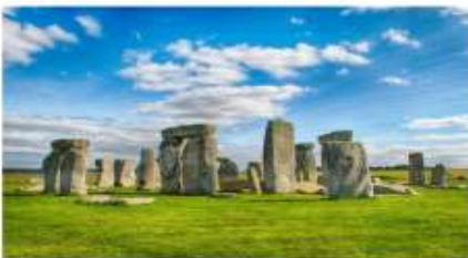
สโตนเฮนจ์