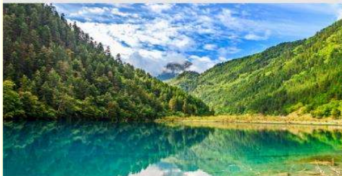
อุทยานฯจิวจ้ายโกว