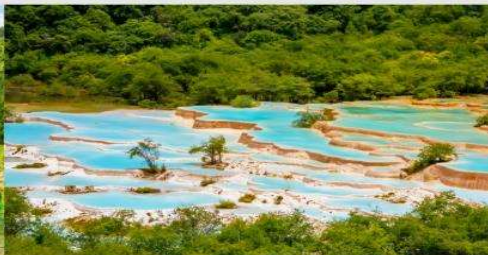
อุทยานฯ หวงหลง