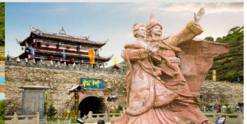
เมืองโบราณชงพาน

*ทางบริษัทฯ ขอสงวนสิทธิ์ในการสลับโปรแกรมทัวร์ตามความเหมาะสมขึ้นอยู่กับสถานการณ์หน้างาน โดยคำนึงถึงผลประโยชน์ของลูกค้าเป็นสำคัญ