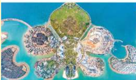
เกาะดอกไม้