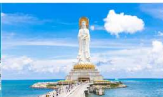
เจ้าแม่กวนอิมหนานชาน