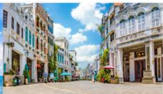
ถนนโบราณฉีไหหลว