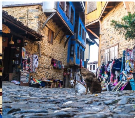
หน้า 15 (ภาพใช้เพื่อการโฆษณาเท่านั้น)