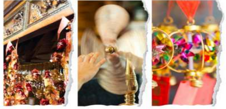
วัดแซกงหมิว

นำท่านขอพรเพื่อเป็นสิริมงคล วัดแห่งนี้เป็นที่คนฮ่องกงให้การเคารพนับถือเป็นอย่างมาก เป็นวัดเก่าแก่และมีชื่อเสียงที่สุดวัดหนึ่งของฮ่องกง เป็น 1 ในวัดของฮ่องกงที่ทุกท่านห้ามพลาดเลยทีเดีย