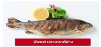
พืชมื้อ ปลาเทราต์ย่าง

ที่พัก : Gartenhotel Maria Theresia Hall หรือโรงแรมและเมืองระดับใกล้เคียงกัน (ชื่อโรงแรมที่ท่านพัก ทางบริษัทจะทำการแจ้งพร้อมใบนัดหมาย 5-7 วัน ก่อนวันเดินทาง)