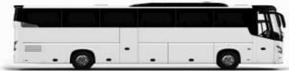
ตัวอย่างรถโดยสาร 1 ชั้น

ค่าที่พักตามที่ระบุในรายการหรือเทียบเท่าระดับเดียวกัน (ห้องพักละ 2 ท่าน) หากประเภทห้องที่ท่านริเวอลมาเกินจาก เช่น ริเวอลห้องพักเป็น TWIN BED หรือ DOUBLE BED ทางบริษัทขอสงวนสิทธิ์ในการปรับประเภทห้องพัก เป็นตามที่โรงแรมมีอยู่ โดยไม่ต้องแจ้งให้ทราบล่วงหน้า