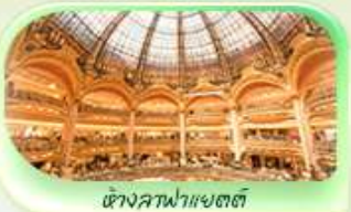
ห้างสรรพสินค้า