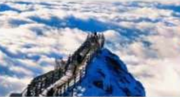
ภูเขาหิมะเจียวจื่อ