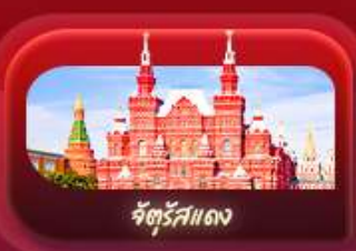
จัตุรัสแดง