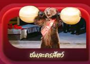
ชมละครสัตว์