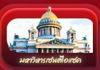
มหาวิหารเซนต์ไอแซค