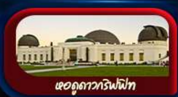
หอดูดาวกริฟฟิท

การันตี 10 ท่านออกเดินทาง พร้อมหัวหน้าทัวร์คนไทย