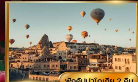
พักคิปปาโดเกีย 2 คืน