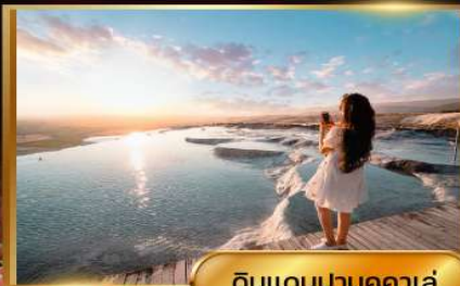
ดินแดนปามุคคาเล่