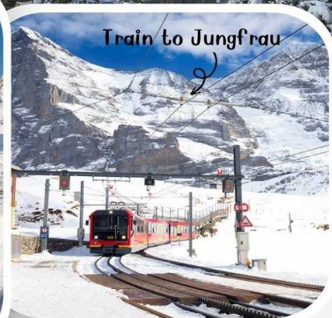
Train to Jungfrau