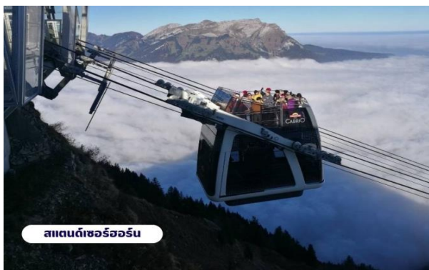
สแตนดเชอร์ฮอร์น

📍 บริการอาหารเช้า ณ ห้องอาหารของโรงแรม จากนั้นนำท่านเดินทางสู่สถานีกระเช้าเพื่อเตรียมตัวเดินทางขึ้นสู่ ยอดเขาสแตนเชอร์ฮอร์น (Mt.Stanserhorn) มีความสูงที่ 1,898 เมตร(6,227 ฟุต) ระหว่างทางคุณจะได้ชมวิวแบบพาโนรามาและให้ท่านได้สัมผัสการเดินทางโดยขึ้นกระเช้า “Cabrio” กระเช้าลอยฟ้าเปิดประทุนที่มี 2 ชั้นแห่งแรกของโลก และสามารถจุผู้โดยสารได้เกือบ 60 ท่าน โดยขึ้นลาดฟ้าจะสามารถจุได้ 30 ท่าน ระยะเกือบ 2 กิโลเมตร ระหว่างทางขึ้นสู่ยอดเขาท่านจะสามารถมองเห็นวิวแบบ 360 องศา จากนั้นให้ท่านได้เพลิดเพลินกับความสวยงามของธรรมชาติและทัศนียภาพที่งดงาม