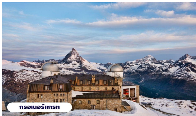
กรอเนอร์เกรท