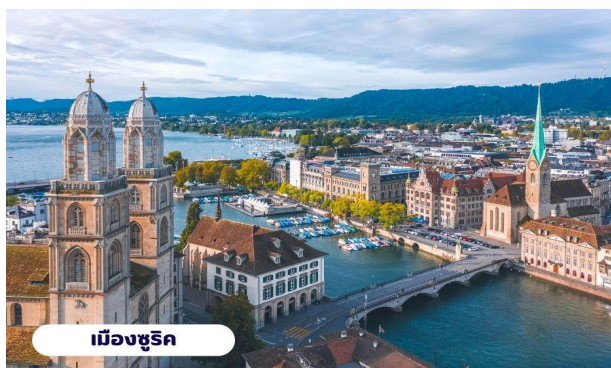
เมืองซูริก

📍 บริการอาหารกลางวัน ณ ภัตตาคาร จากนั้นนำท่านลงจากยอดเขาและเดินทางต่อไปยัง เมืองซูริก ใช้เวลาเดินทางประมาณ 1 ชั่วโมง นำท่านเที่ยวชม จัตุรัสพาราเดพลาทซ์ (Paradeplatz) จัตุรัสเก่าแก่ที่มีมาตั้งแต่สมัยศตวรรษที่ 17 ในอดีตเคยเป็นศูนย์กลางของการค้าสัตว์ที่สำคัญของเมืองซูริก ปัจจุบันจัตุรัสนี้ได้กลายเป็นชุมทางรถรางที่สำคัญของเมืองและยังเป็นศูนย์กลางการค้าของย่านธุรกิจ ธนาคาร สถาบันการเงินที่ใหญ่ที่สุดในประเทศสวิตเซอร์แลนด์ นำท่านแวะถ่ายรูปกับ โบสถ์ฟรอมุนสเตอร์ (Fraumunster Abbey) จากบนสะพานมุนสเตอร์บรุค เป็นโบสถ์ที่มีชื่อเสียงของเมืองซูริก สร้างขึ้นในปี ค.ศ. 853 โดยกษัตริย์เยอรมันหลุยส์ ใช้เป็นสำนักแม่ชีที่มีกลุ่มหญิงสาวชนชั้นสูงจากทางตอนใต้ของเยอรมันอาศัยอยู่ นำท่านสู่ ถนนบาห์นโฮฟชตราสเซอร์