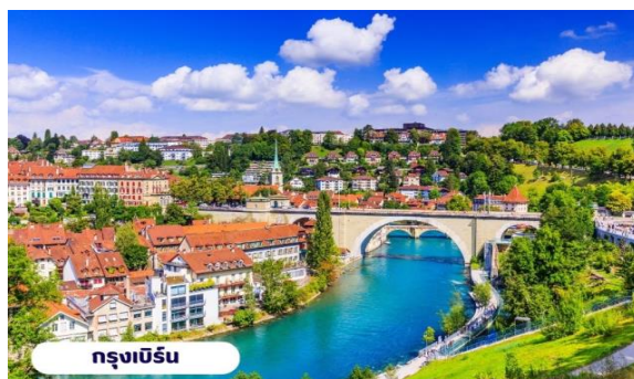
กรุงเบิร์น

👁️ บริการอาหารเช้า ณ ห้องอาหารของโรงแรม จากนั้นนำท่านเที่ยวชมสถานที่สำคัญต่างๆในกรุงเบิร์น กรุงเบิร์นได้รับการยกย่องจากองค์การยูเนสโกให้เป็นเมืองมรดกโลก ในปี ค.ศ. 1863 นอกจากนี้เบิร์น ยังถูกจัดอันดับอยู่ใน 1 ใน 10 ของเมืองที่มีคุณภาพชีวิตที่ดีที่สุดในโลกในปี ค.ศ. 2010 นำท่านชม บ่อหมีสีน้ำตาล สัตว์ที่เป็นสัญลักษณ์ของกรุงเบิร์น นำท่านชม มาร์กาเซ ย่านเมืองเก่า ปัจจุบันเต็มไปด้วยร้านดอกไม้และบูติก เป็นย่านที่ปลอดภัยยิ่ง จึงเหมาะกับการเดินเที่ยวชมอาคารเก่า อายุ 200-300 ปี นำท่านลัดเลาะชมถนนจุงเคอร์นกาเซ ถนนที่มีระดับสูงสุดของเมืองนี้ ซึ่งเต็มไปด้วยร้านภาพวาดและร้านขายของเก่าในอาคารโบราณ ชมนาฬิกาไข้ทคล็อคเค้นทรีม อายุ 800 ปี ที่มีโชว์ให้ดูทุกๆชั่วโมงในการตีบอกเวลาแต่ละครั้ง หอนาฬิกานี้ ในช่วงปี ค.ศ. 1191-1256 ใช้เป็นประตูเมืองแห่งแรก ภายหลังได้ดัดแปลงไข้ทคล็อคเค้นทรีมให้กลายมาเป็นหอนาฬิกา พร้อมติดตั้งนาฬิกาดาราศาสตร์เข้าไป จากนั้นอิสระให้ท่านเดินเล่นและเก็บภาพตามอัธยาศัยหรือจะเลือกช้อปปิ้งซื้อสินค้าแบรนด์เนมและช็อคโกแลตที่ระลึก