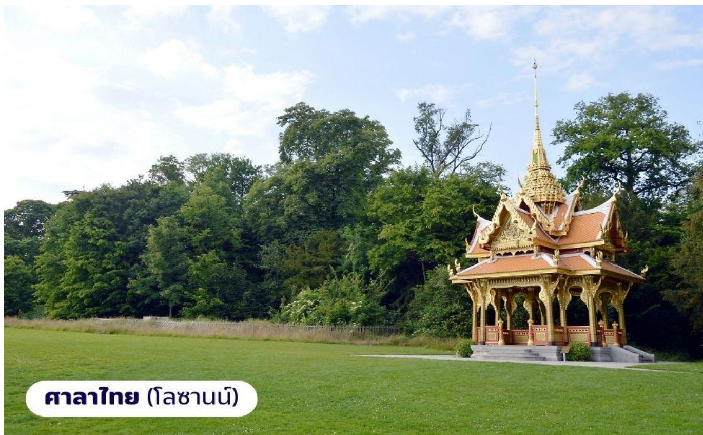
ศาลาไทย (โลซานน์)

จากนั้นนำท่านเดินทางไปยัง เมืองโลซานน์ เป็นอีกเมืองที่ตั้งอยู่บนของทะเลสาบเจนีวา เมืองโลซานน์นับได้ว่าเป็นเมืองที่มีเสน่ห์โดยธรรมชาติมากที่สุดเมืองหนึ่งของ สวิตเซอร์แลนด์มีประวัติศาสตร์อันยาวนานมาตั้งแต่ศตวรรษที่ 4 ในสมัยที่ชาวโรมันมาตั้งหลักแหล่งอยู่บริเวณริมฝั่งทะเลสาบที่นี่ เนื่องจากเมืองโลซานน์ตั้งอยู่บนเนินเขาริมฝั่ง ทะเลสาบเลคเลมังค์ จึงมีความสวยงามโดยธรรมชาติ ทิวทัศน์ที่สวยงามและอากาศที่ ปราสจากมลพิษ จึงดึงดูดนักท่องเที่ยวจากทั่วโลกให้มาพักผ่อนตากอากาศที่นี่ เมืองนี้ยังเป็นเมืองที่มีความสำคัญสำหรับชาวไทยเนื่องจากเป็นเมืองที่เคยเป็นที่ประทับของสมเด็จพระเจ้า ให้นำท่านถ่ายภาพ อาคารสำนักงานโอลิมปิกสากล ซึ่งตั้งอยู่บริเวณทะเลสาบเลคเลมังค์ จากนั้นนำท่านถ่ายภาพและเยี่ยมชม ศาลาไทย ที่รัฐบาลไทยได้ร่วมกันก่อสร้างให้เมืองโลซานน์ ในโอกาสเฉลิมฉลองพระบาทสมเด็จพระเจ้าอยู่หัวทรงครองราชย์ครบ 60 ปีและ เชื่อมความสัมพันธ์ไทย-สวิสฯ ครบ 75 ปี