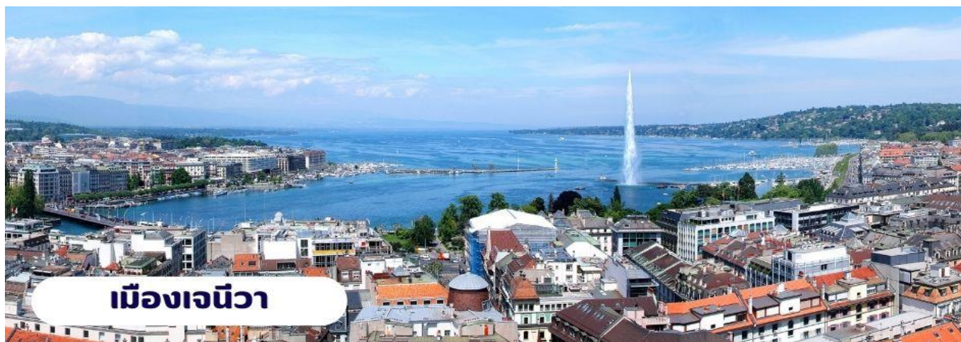
เมืองเจนีวา