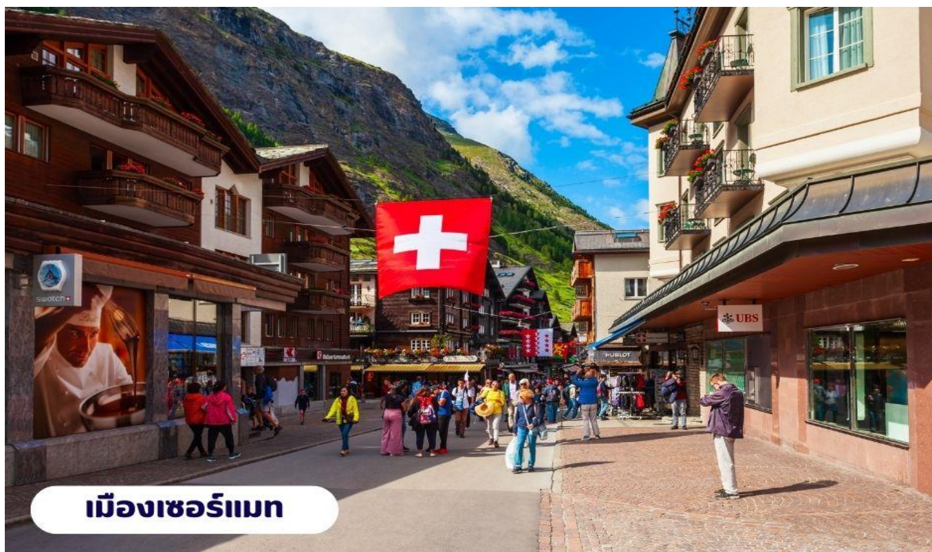
เมืองเซอร์แมท

☺ บริการอาหารเช้า ณ ห้องอาหารของโรงแรม จากนั้นนำท่านเดินทางสู่ เมืองแทสช์ (Tasch) ใช้เวลาเดินทางประมาณ 2.30 ชั่วโมง ตั้งอยู่ในประเทศสวิตเซอร์แลนด์ เป็นประเทศขนาดเล็กที่ไม่มีทางออกสู่ทะเล และตั้งอยู่ในทวีปยุโรปตะวันตก ซึ่งมีเทือกเขาแอลป์ ซึ่งเป็นเทือกเขาที่ใหญ่ที่สุดของทวีปยุโรป เลาะเลียบตามหุบเขา ชมทิวทัศน์สวยสดงดงามตลอดเส้นทาง จากนั้นนำท่านเดินทางโดยรถไฟสู่เมืองเซอร์แมท (Zermatt) ใช้เวลาเดินทางประมาณ 15 นาที โดยรถไฟซึ่งเป็นเมืองที่ไม่อนุญาตให้รถยนต์วิ่งและเป็นเมืองที่ได้รับการยกย่องว่าปลอดภัยที่สุดในโลกตั้งอยู่บนความสูงกว่า 1,620 เมตร ซึ่งเป็นที่ตั้งของยอดเขาแมทเทอร์ฮอร์น ซึ่งเป็นสัญลักษณ์ของสวิตเซอร์แลนด์ เมืองเซอร์แมทเป็นเมืองเล็กๆ หรืออาจจะเรียกได้ว่าเป็นหมู่บ้านก็ได้ เพราะว่ามีประชากรในเมืองไม่ถึง 10,000 คน ทางตอนใต้ของสวิตติดกับชายแดนอิตาลี โดยมี Pennine Alps ซึ่งเป็นส่วนหนึ่งของเทือกเขา Alps เป็นเส้นกั้นระหว่าง 2 ประเทศหากพูดถึง Zermatt ก็ต้องนึกถึงยอดเขาแหลมที่มีลักษณะคล้ายปิรามิด ชื่อว่า Matterhorn ที่ตั้งตระหง่านอยู่ใกล้ๆ เมือง มีความสูงถึง 4,478 เมตร สามารถมองเห็นได้จากแทบทุกมุมของเมือง ซึ่ง Matterhorn นี้ถือเป็นสัญลักษณ์ที่สำคัญของ Zermatt